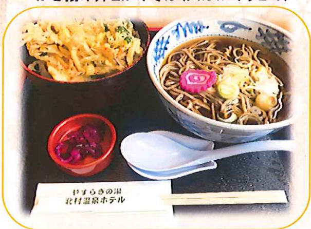
かき揚げ井とかけそば(又はかけうどん)