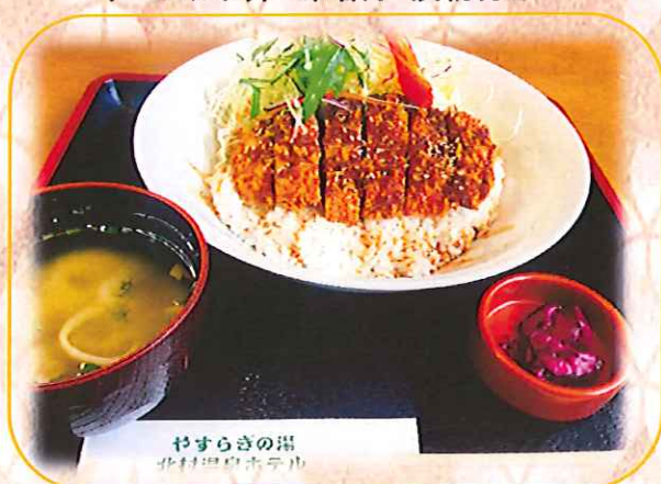
ソースカツ丼 味噌汁・漬物付き